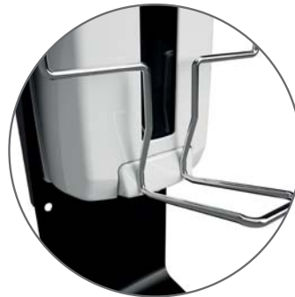
Barre de pression qualité premium