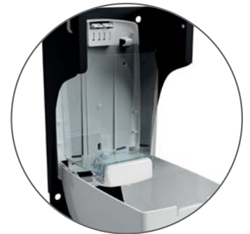
Réservoir transparent Pompe anti-gouttes