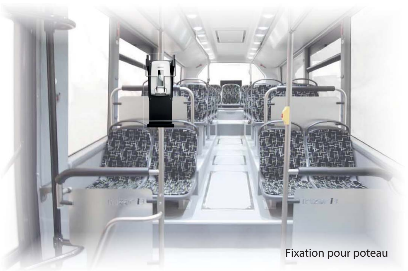
Fixation pour poteau